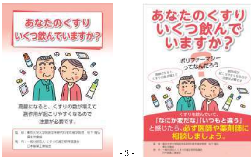
図1 一般社団法人くすりの適正使用協議会ウェブサイト「あなたのくすりいくつ飲んでいきますか」のパンフレット(図左)、ポスター(図右)のイメージ

https://www.rad-ar.or.jp/knowledge/post?slug=polypharmacy